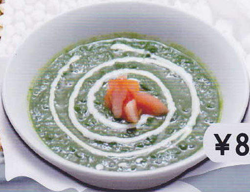
[36] MUTTON SAG CURRY ほうれん草とマトンカレー