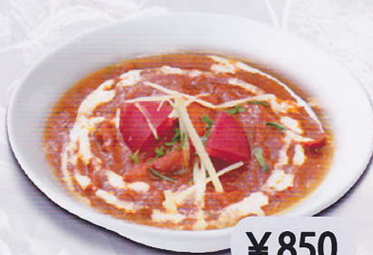
[35] MUTTON MASALA CURRY マトンマサラカレー