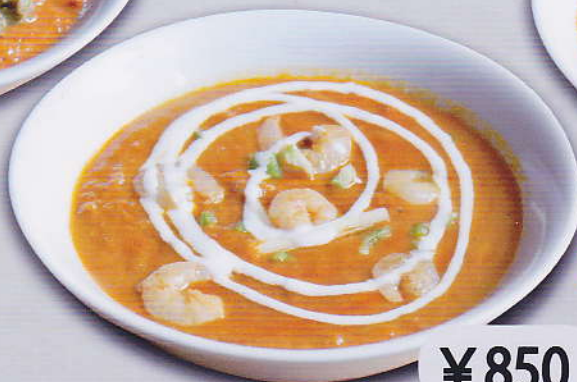
[39] PRAWN CURRY 海老カレー