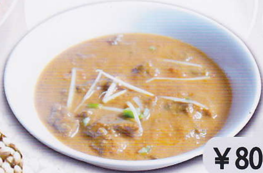
[34] MUTTON CURRY マトンカレー