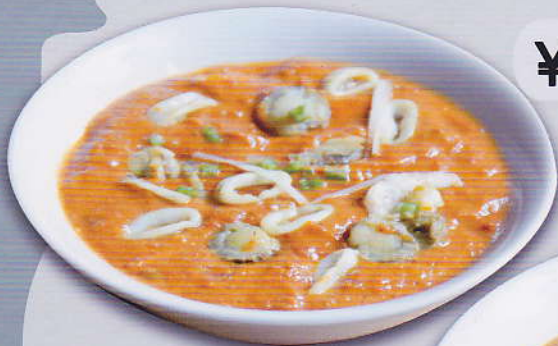
[37] MIX SEA FOOD CURRY ミックスシーフードカレー