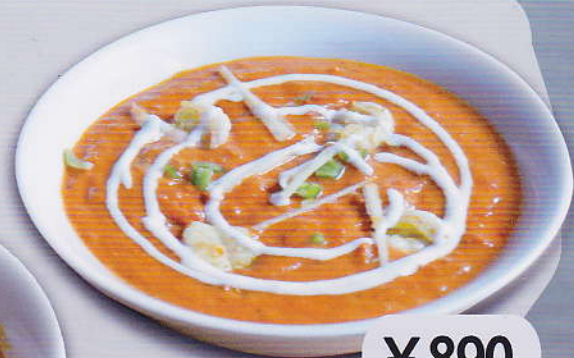
[38] PRAWN MASALA CURRY 海老マサラカレー