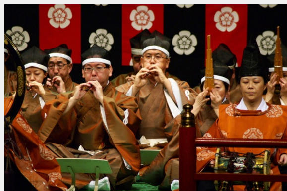
前回の演奏会より